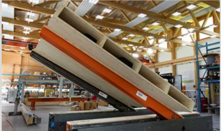
Abb.: Das Wende- und Aufrichtsystem TW-Flip – hier noch in der Dauertest-Phase, aber mittlerweile im reellen Einsatz.

kontrolliert gewendet. Das schnelle Wenden ohne Hilfsmittel - also ohne Kran, ohne Stapler und ohne Aufhängung - bringt weitere Effizienz in den Holzbaubetrieb.