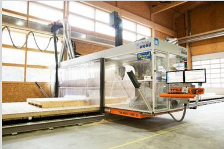
Abb.: Schweizer Qualität - hochwertige Komponenten und individuelle Ausführung der Anlage dank modularem Aufbau

Die TW-Mill E ist konzipiert für die Bearbeitung von Element- und Holzrahmenbau. Kernstück ist das „E-Modul“, welches variabel verschiedene Nagel-, Klammer-, Schraub-, und Leimgeräte aufnimmt. Eine separate, leistungsstarke Spindel ermöglicht zudem vollständige Abbund-, und Platten- bis hin zu Freiformbearbeitungen. Die TW-Mill E ist eine Anlage für effiziente Standard- und flexible Spezialbearbeitungen.