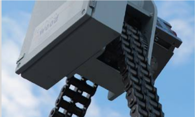
Abb.: innerhalb eines grossen Aktionsradius (bis 100 m) lassen sich Lasten bis 5 Tonnen über Fernsteuerung exakt positionieren.

Selbstverständlich informieren wir Sie auch gerne zu den weiteren Produkten aus unserem Sortiment.