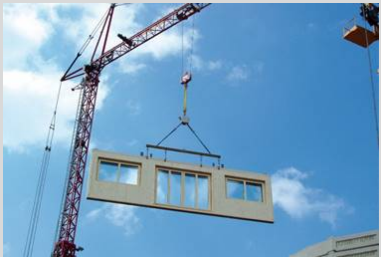
Abb.: hohe Sicherheit und eine massive Verkürzung der Montagezeit für Kran und Monteure sprechen für die TW-Balance

Die TW-Balance setzt mit hoher Präzision die Elemente an gewünschter Stelle ab. So können z.B. Dachelemente exakt in die richtige Neigung gedreht werden.