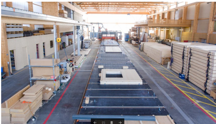
Die TW-Concept Line von Technowood bei der Uffer AG, Savognin in der Schweiz.